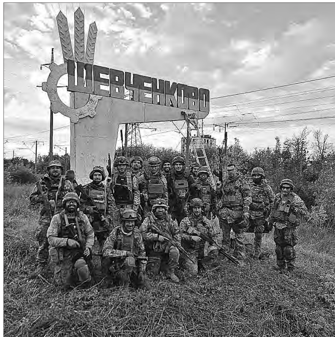
Вересень 2022 року.

Бійці територіальної оборони України біля свіжо перефарбованого (з кольорів російського прапора на український) в'їзного знаку у визволеному від російської армії селищі Шевченковому Харківської області.