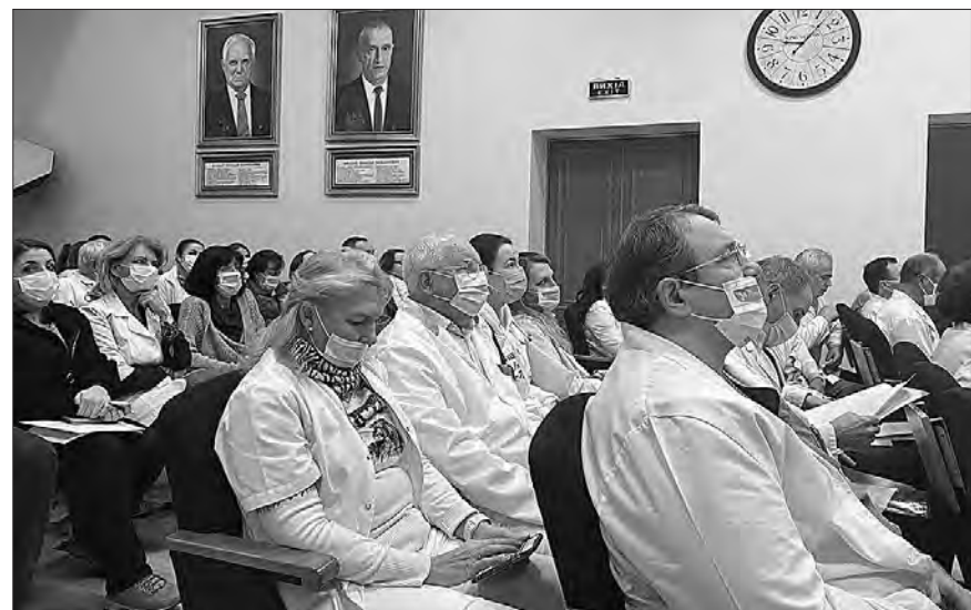
Ранок у Національному інституті серцево-судинної хірургії ім. М. М. Амосова.

надання допомоги пораненим військовим і цивільним, розробили оптимальні маршрути для цих пацієнтів. Персонал діагностичних та лікувальних служб перевели на цілодобовий режим роботи. А все інше зробив хірургічний клас фахівців інституту та їхня працездатність: традиційні конкуренти амосовців — Інститут серця МОЗ України, Центр дитячої кардіології та кардіохірургії МОЗ, Дніпропетровський, Вінницький та Черкаський обласні кардіоцентри, Одеська й Львівська обласні лікарні — поступилися потужній команді серцево-судинних хірургів Інституту Амосова. Перевага амосовців в абсолютних показниках неспростовна: загальна кількість втручань триумфаторів року — 4604! Кількість операцій на серці — 2409, хірургічне лікування ішемічної хвороби й ізольоване коронарне шунтуван-