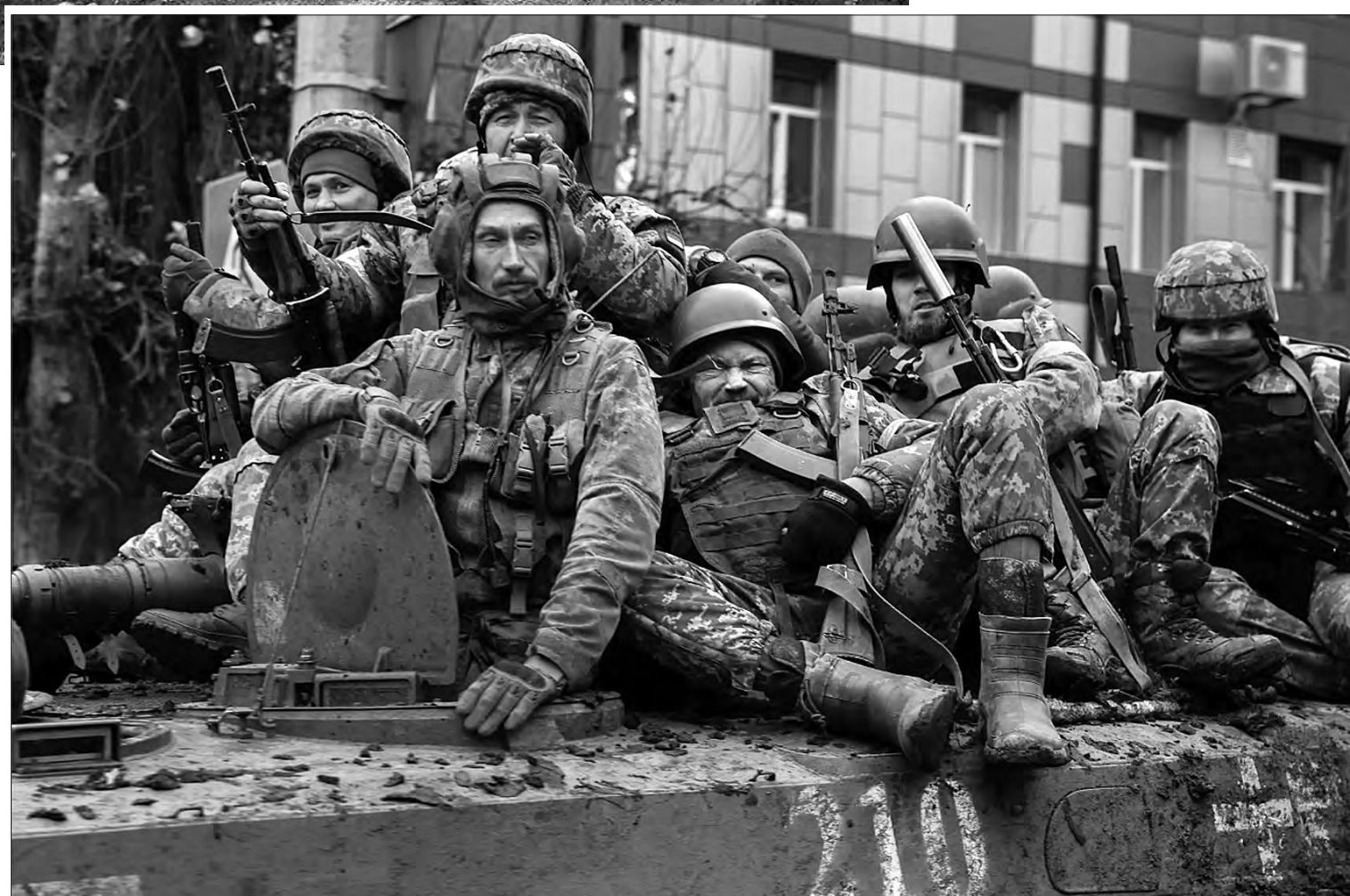
Українські військові в Бахмуті. Битва за Бахмут — найкровопролитніша битва з початку повномасштабного російського вторгнення в Україну 2022 року.

Понад 2 місяці тривала операція з визволення острова Зміїний у Чорному морі (входить до складу Одеської області). З кінця лютого він був окупований російською армією.