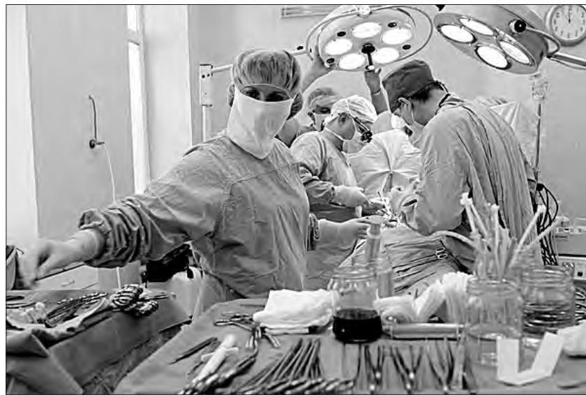
Франківські лікарі разом із хірургами Інституту Амосова оперують на відкритому серці.

ня — 509, хірургічне лікування вроджених вад серця — 493, патології аорти — 187, інфекційного ендокардиту — 172. Фахівцю ці цифри коментувати немає сенсу, аматори цілком можуть вигукнути: Інститут Амосова — чемпіон! Що у перекладі з пізнолатинської означає «боєць, переможець». Хто б сумнівався!