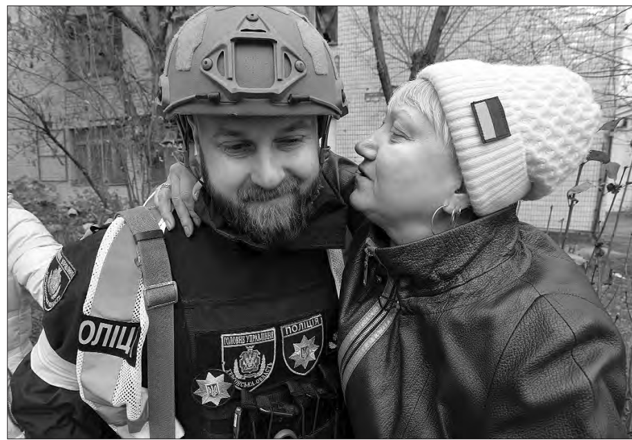
16 листопада 2022 року. Визволення Херсона.