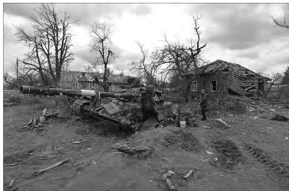
10 квітня 2022 року. Наслідки боїв у Чернігові.