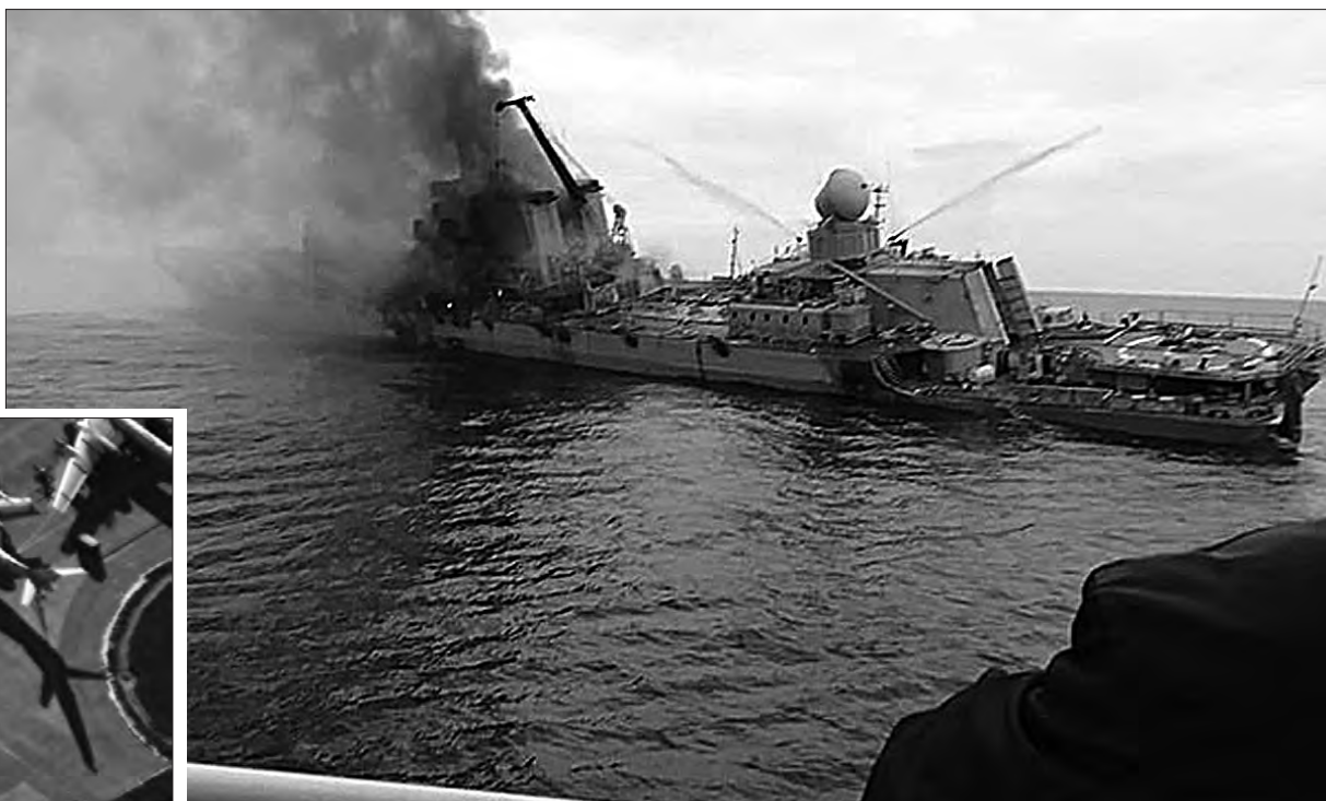
Увечері 13 квітня 2022 року стало відомо, що українськими протикорабельними ракетами «Нептун» було вражено флагман чорноморського флоту рф ракетний крейсер «Москва». Після цього крейсер із 16 крилатими ракетами вийшов з ладу та затонув.

Від аеродрому в Енгельсі до найближчої території, підконтрольної Україні, приблизно 700 кілометрів. На авіабазі розміщуються стратегічні бомбардувальники Ту-160 та Ту-95МС. З аеродрому, зокрема, злітають російські літаки, які атакують цілі в Україні. Ту-95МС та Ту-160 — носії ядерної зброї та входять до складу російських сил стримування ядерної загрози.