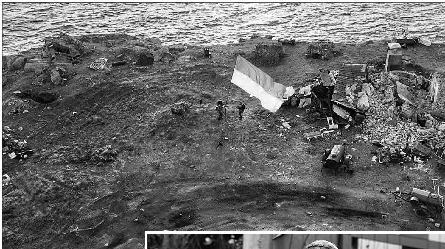
Українські бійці встановлюють Державний прапор на острові Зміїний у Чорному морі (Одеська область). Фото опубліковано 7 липня 2022 року.

Понад 2 місяці тривала операція з визволення острова Зміїний у Чорному морі (входить до складу Одеської області). З кінця лютого він був окупований російською армією.