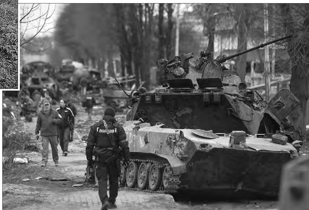
Квітень 2022 року. Буча, вулиця Вокзальна.