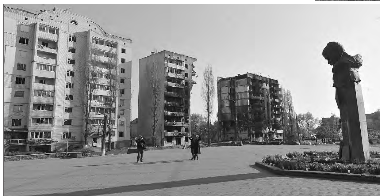
6 травня 2022 року.