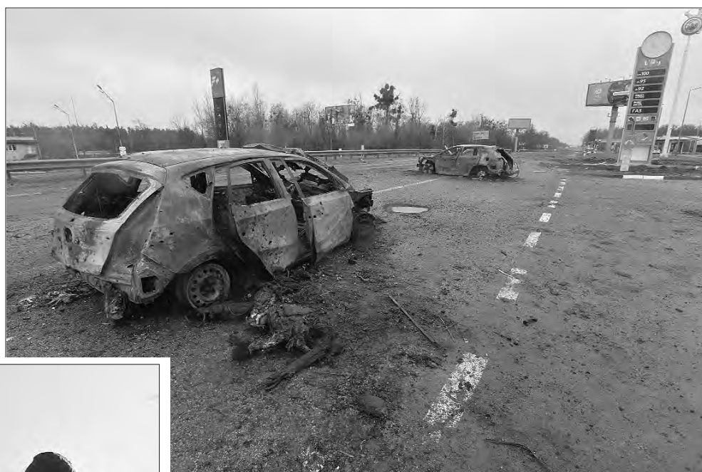
2 квітня 2022 року.

На дорозі біля Милої стоять розстріляні росіянами автомобілі та лежать тіла людей. Мирні жителі намагались вирватись з Києва по Житомирській трасі.